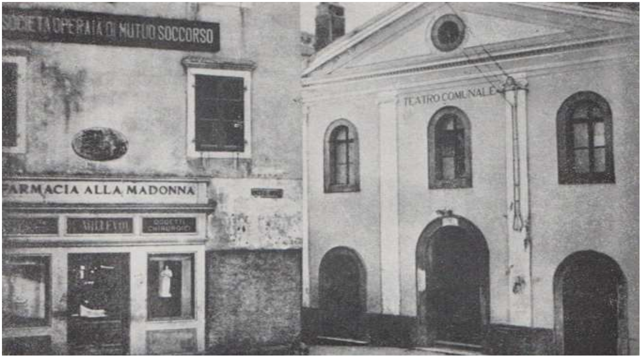
Antica sede della S.O.M.S. sopra la "Farmacia alla Madonna" e di fianco al "Teatro Comunale".